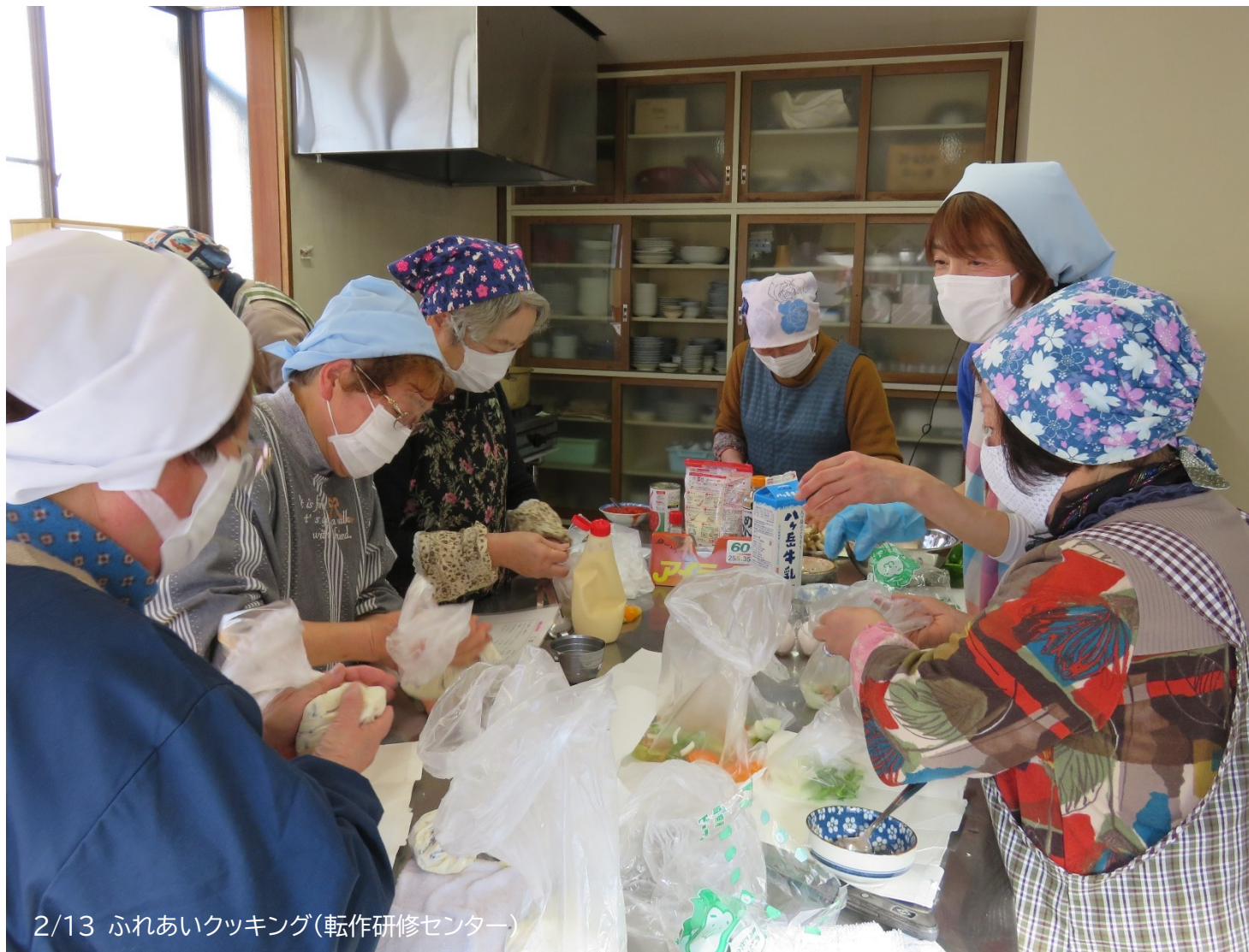
2/13 ふれあいクッキング(転作研修センター)