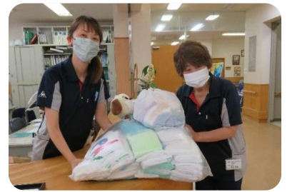
介護老人保健施設 萌生の里

小木曽地区老人クラブ「楽生会」は、数年前から地域のために何かできることはないかと、会員から未使用タオルを集め福祉施設等に寄付をしています。今年も約300枚ものタオルが集まり、近隣4カ所の事業所にお届けしました。タオルは、日々の介護や清掃など使う機会がたくさんあり、事業所の皆さんから大変喜ばれています。