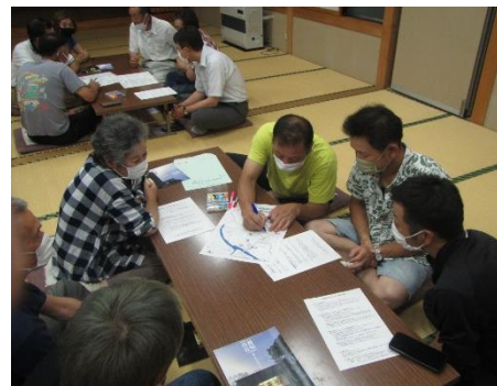
17区 支え合いマップ見直し

マップの内容に大きな変更はないかもしれませんが、それでも、避難訓練のように繰り返し繰り返し行うことで、いざという時にきっと役立つものになるはずです。