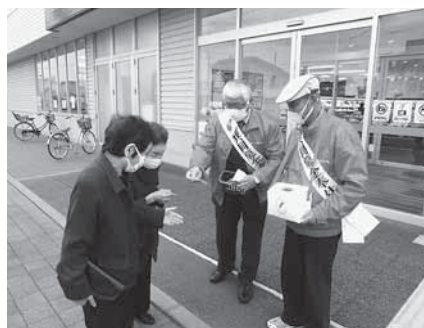
(エーコープないえ店前)