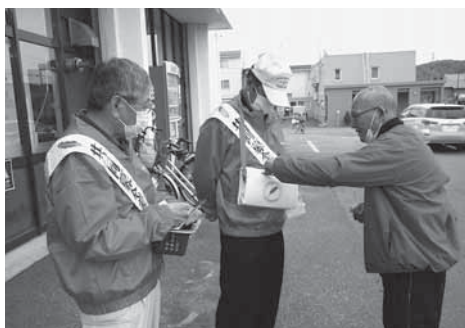
(ふじアシルマート奈井江店前)

集まった共同募金は福祉施設の整備や高齢者団体、ボランティア団体及び社会福祉協議会に配分されております。「社協だより」も共同募金配分金により作成されております。