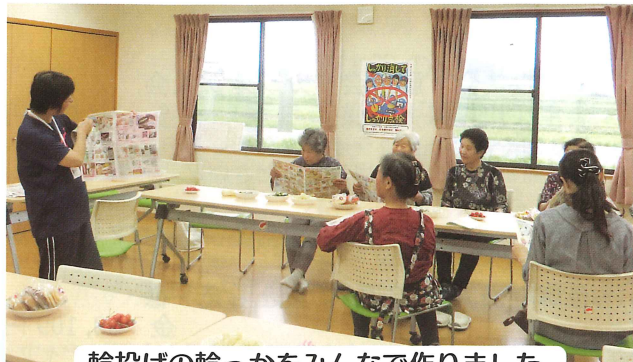
輪投げの輪っかをみんなで作りました。