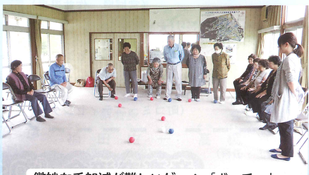
微妙な手加減が難しいゲーム「ポッチャ」。