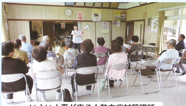
いよいよ夏が来る！熱中症対策講話。