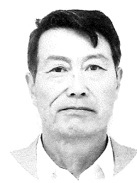
きた だて えな み 北 館 襲 巳 (新任・下黒沢)