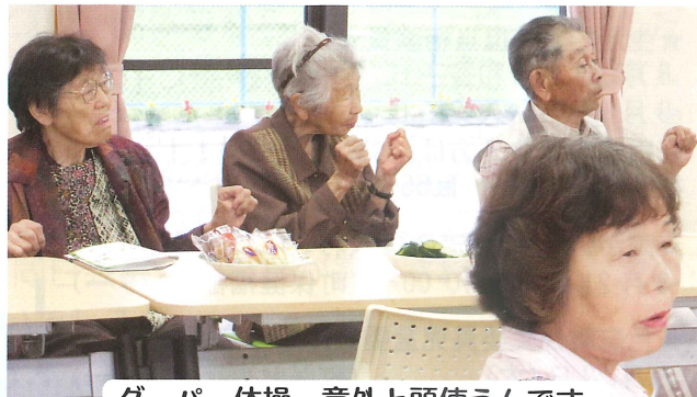
グーパー体操。意外と頭使うんです。