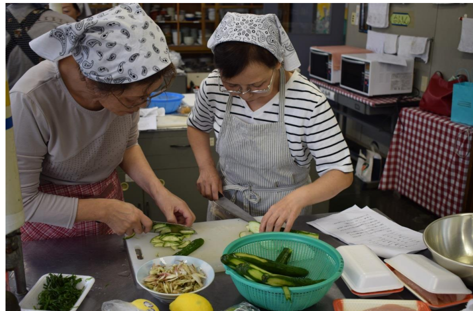
第2回目：食材を切っている様子