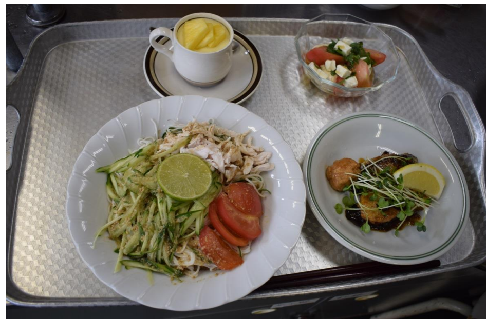
完成した料理（第2回目）

左下：枝豆パン・スパイシー肉巻き、右下：まるまる新玉ねぎスープ 左上：セロリとみょうがのサラダ、右上：ヨーグルトゼリー