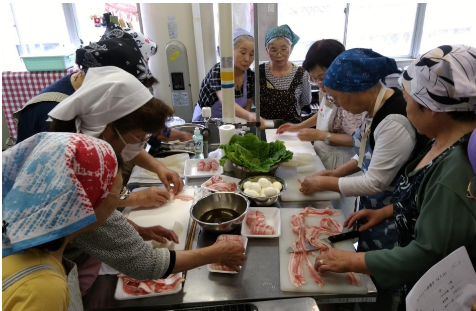
第1回目：スパイシー肉巻きを作っている様子