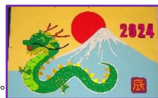
完成したちぎり絵(辰)

※ 獅子島ひろばは、獅子島アイランドセンター（片側） 10:00～15:00 です。