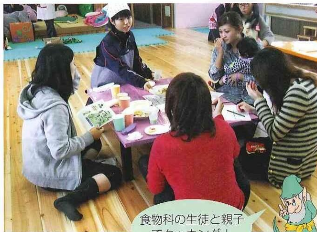
食物科の生徒と親子 でクッキング!