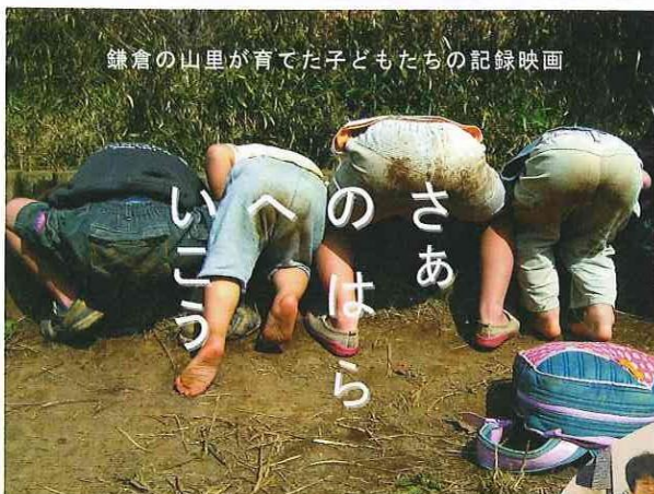
鎌倉の山里が育てた子どもたちの記録映画

在宅で要介護生活をおくっていらっしゃる方々に、手作りの誕生日プレゼントを差し上げています。製作はサロン系あそびの皆さん、材料代に共同募金が使われています。