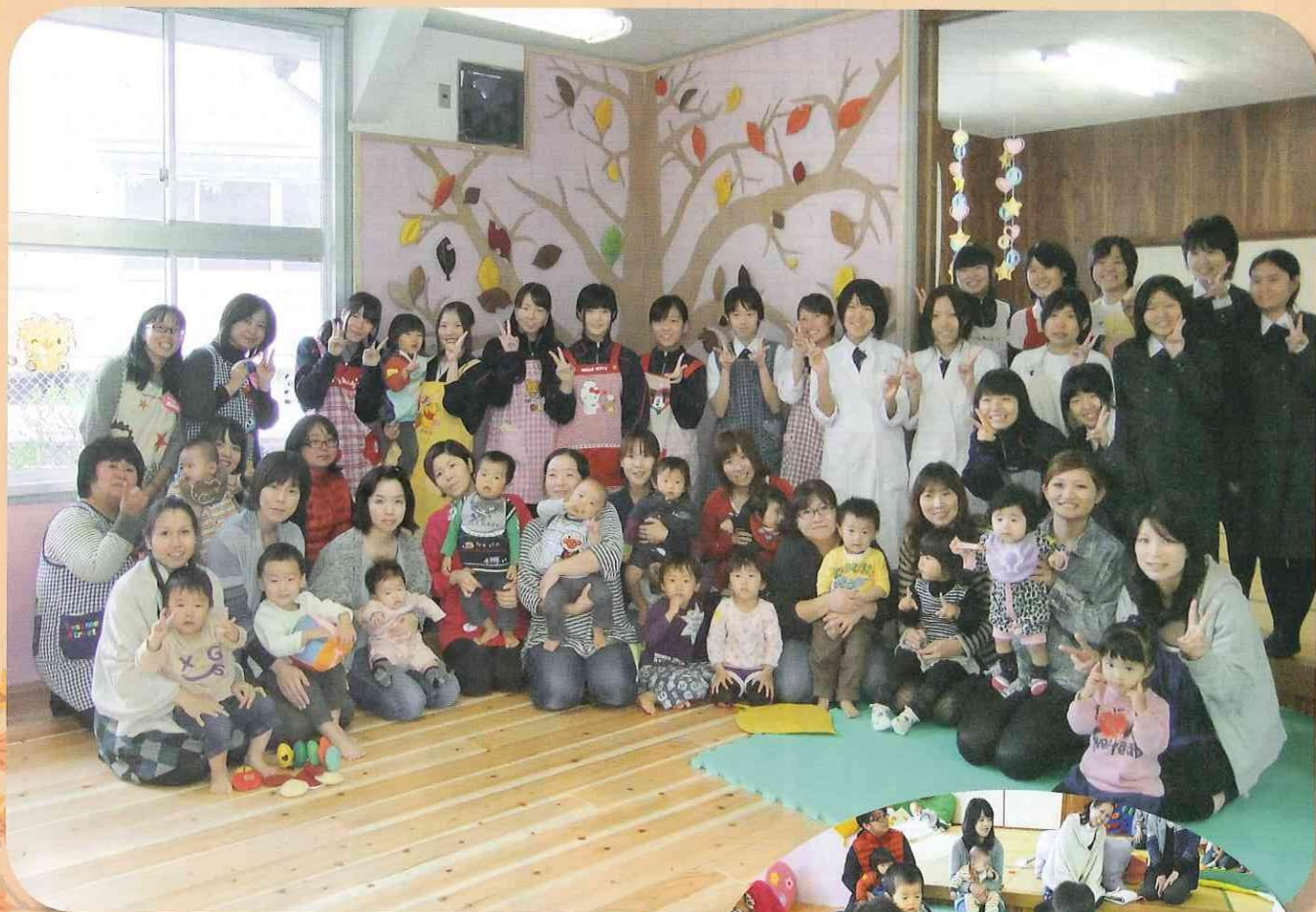
子どもの森プロジェクト 森の保育園(野田女子高校内)

編集・発行 社会福祉法人出水市社会福祉協議会 出水市平和町97番地(出水市社会福祉会館) ☎023-2140 平成24年11月29日発行