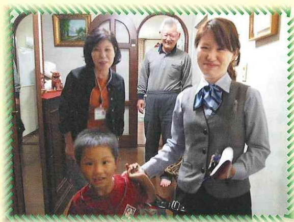
お迎えにいらしたお母さんと