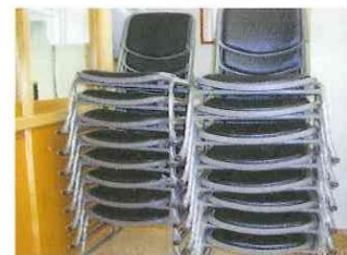
低座椅子購入 (松尾自治会)