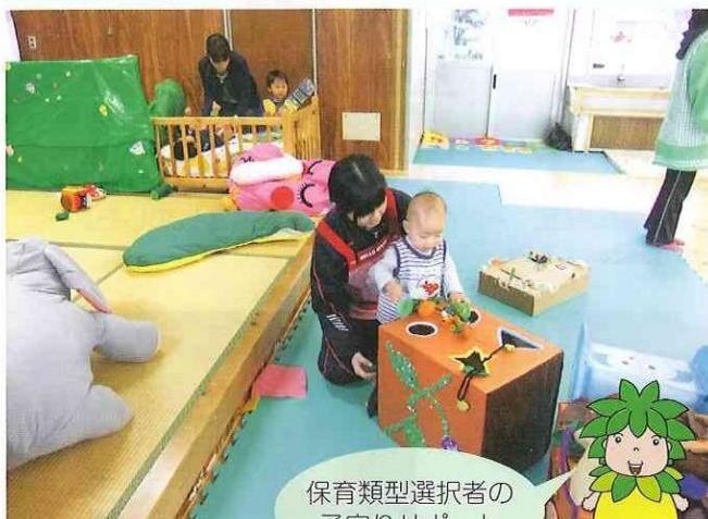
保育類型選択者の 子守りサポート

野田女子高校では、「平成24年度かごしま専門学校パワーアップ・プロジェクト」の指定を受け、「こどもの森」プロジェクトを立ち上げました。連携校である出水工業高校と出水市社会福祉協議会の協力のもと、学校内の家庭経営実習棟をリニューアルし、地域のこどもたちが安心安全に遊べる『森の保育園』を造りました。