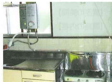
湯沸し器ガスコンロ購入 (旭自治会)