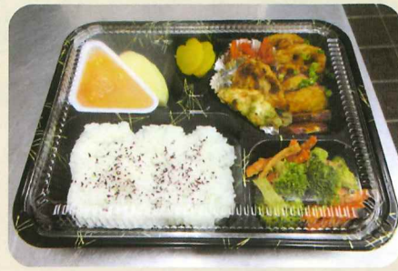
9月第1回目の手作りお弁当

ボランティア同士が「出会い」「ふれあい」 「語り合い」「協力し合い」季節の食材なども 使用し、特製オリジナルふれあい弁当をつくります。