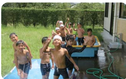
みんなで水あそび!(夏休み)