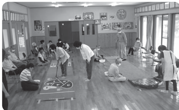
宮原地区：ゲームの様子

※お達者クラブでは、足腰に不安があり地区の公民館まで歩いていけない方への送迎を行っています。ご希望の方は、スタッフまでお声掛けください。