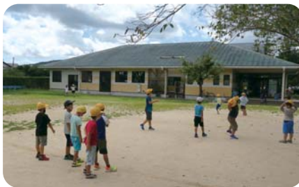
みんなであそぼう(異年齢交流)