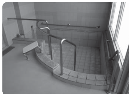
大浴場及び居室内浴室完備