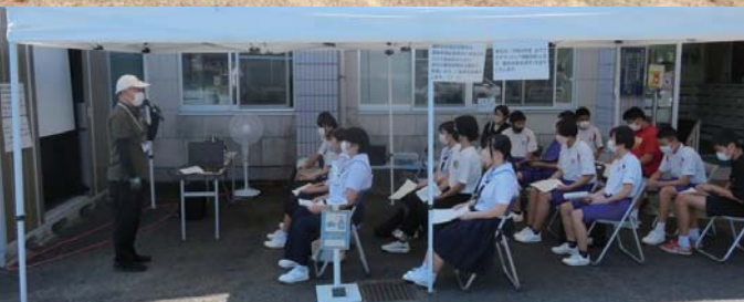
ボランティア体験事前説明会は、コロナ感染防止のため屋外で実施しました。

綾町社会福祉協議会では、日常的なボランティア活動への参加促進を目的として、7月～9月の3ヵ月間を「みやざきボランティア体験月間」として提唱し、ボランティア活動のきっかけづくりを応援しています。今年も高齢者福祉施設や保育所等で、たくさんの皆さんが感染対策をしながらボランティアの体験をしました。