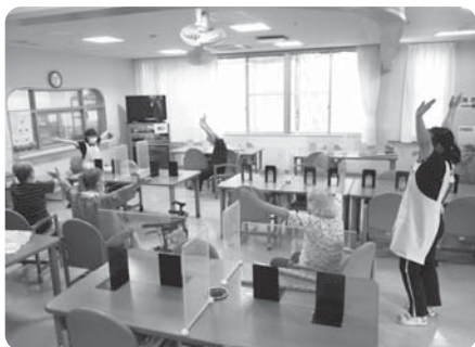
機能訓練は職員と一緒に

保育所・幼稚園との交流・各種イベントへの参加・陶芸教室 映画上映会・お誕生会(4か月1回)・お茶会・行事食・ドライブ お買い物などなど (現在は制限中)