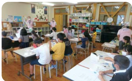
おもちゃ病院(偶数月第3土) 夏休みおもちゃ病院工作教室