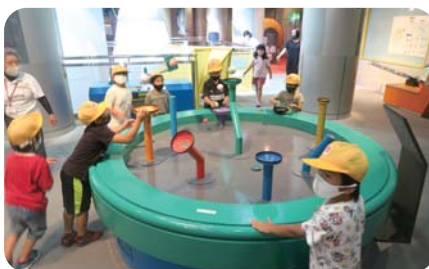
夏休み遠足(令和3年8月宮崎科学技術館)