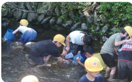
自然体験活動(ネイチャーゲーム)