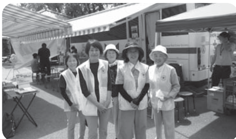
献血会場でのお手伝い