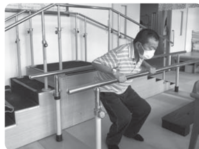
食後の体操の様子