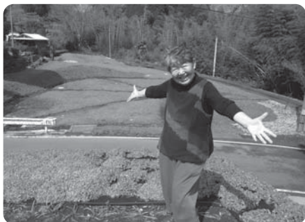
ようやく行けたドライブ