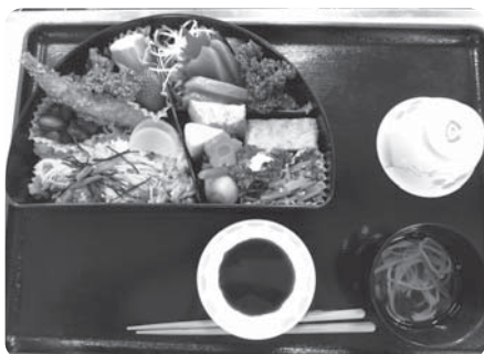
栄養士の献立による食事の提供