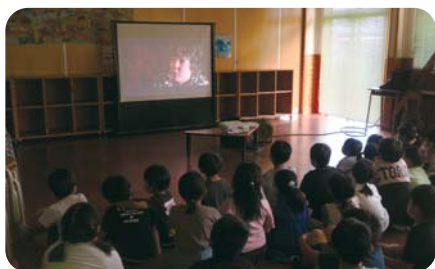
映画鑑賞会(夏休み)

児童館内に専用の児童クラブ室を設け、「放課後児童健全育成事業」を実施しています。小学校に就学している児童で、その保護者が仕事等により昼間家庭にいないものに適切な遊び及び生活の場を与えて、その健全な育成を図ることを目的としています。綾小中学校に在学する1年生から3年生の放課後児童を対象としています。