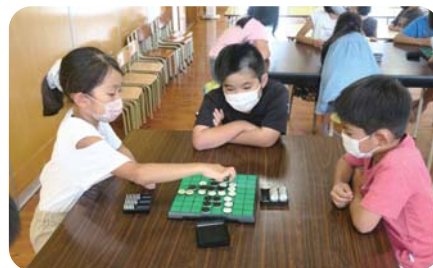
合同オセロ選手権