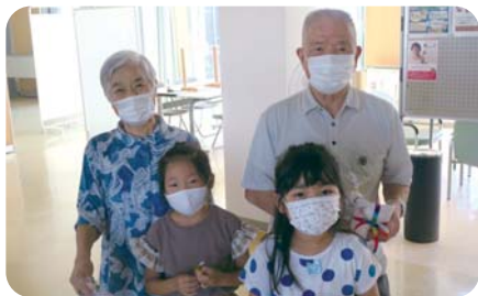
ケアハウスうるおいの里との交流会

綾町児童館は、児童に健全な遊びを与えて、その健康を増進し、又は情操を豊かにすることを目的として平成11年4月1日開館、24年目を迎えています。綾小中学校より徒歩で数分、中央ふれあい公園に隣接と環境にも恵まれ、小学生を中心に1日平均約90名、年間延べ2万4千人程の利用があり異年齢交流の場にもなっています。館内には遊戯室、集会室、図書室、調理室、児童クラブ室があります。全ての児童が気軽に利用でき、バスケットボール、サッカー、一輪車、ドッジボールなどいろいろな遊びや、合同オセロ大会、合同プラバン工作など、児童館と児童クラブ児童の交流を目的とした合同の行事、各施設・団体との交流会、おもちゃ病院、詩吟教室他、さまざまな体験ができる「遊びの広場」です。利用は原則として無料です。