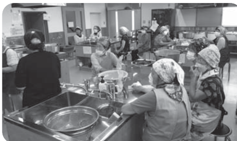
ハイゼックス袋を使った調理研修