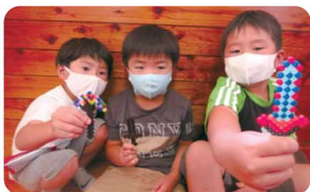
アイロンビーズで作ろう(夏休み)