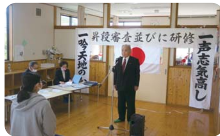
宮崎吟詠会詩吟教室(毎週土)