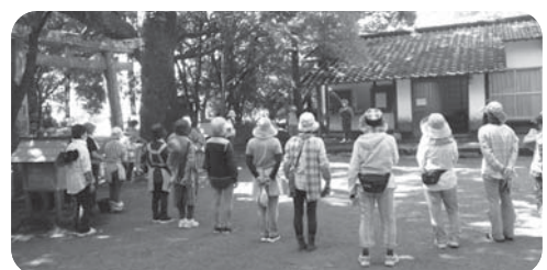
夏祭り 綾神社清掃活動