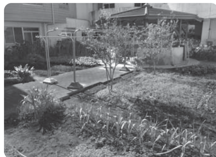
中庭では各自が野菜や花を育ててます