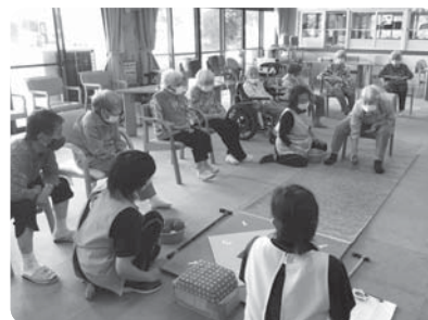
レクリエーション『狙いを定めて!』