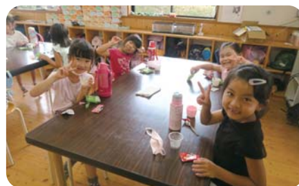
楽しいおやつの時間です