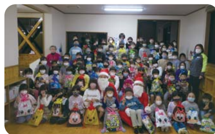
クリスマス会(綾町青年団のサンタさん)

※昨年に続き今年度も、新型コロナウイルス感染症の影響により、計画通り活動ができませんでした。