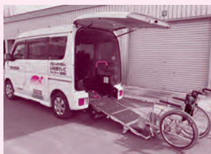
スズキ エブリー (車イス1台+3人乗車)