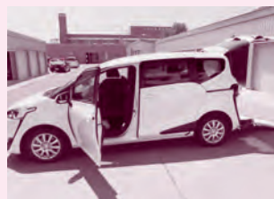
トヨタ シエンタ (車イス1台+2名乗車)