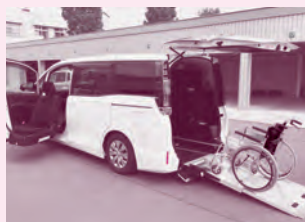
トヨタ ヴォクシー (車イス2台+3人乗車)