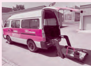
ニッサン キャラバン (車イス1台+8人乗車)