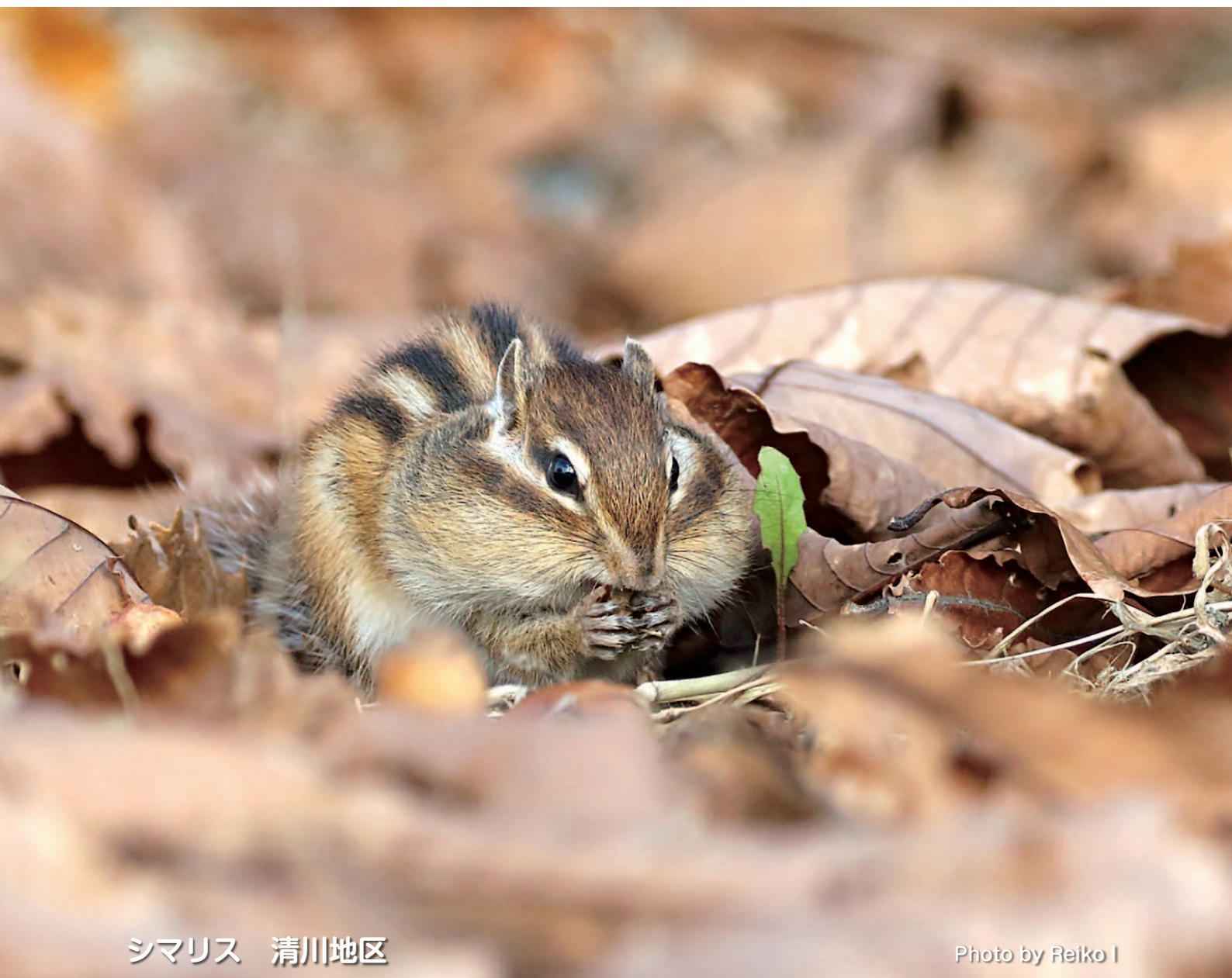
シマリス 清川地区