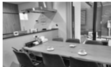
温かい食事をみんなでいただくダイニング

不安な時、困った時、悲しい時にはグループホームの支援員さんがいます。話を聞いてもらって落ち着いて、また次のことが考えられるようになりました。愛犬のポチとも散歩にも出られるようになりました。誰かが寄り添ってくれているグループホームでこれからもポチと一緒に穏やかに暮らしていきたいです。