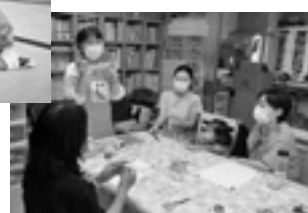
コミュニティカフェの運営