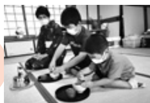
子どもの健全育成