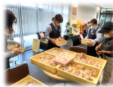
JA 東びわこ多賀支店

工房せせらぎでは、日替わりで各地に訪問販売に伺っています。毎週火曜日は多賀町の企業様、施設様を訪問しています。お昼休みの時刻に場所をお借りして焼きたてのパンを並べると、皆さま笑顔でお好みのパンを選び購入してくださいます。季節限定品や、ミニ食パンをはじめ「うわー、これが美味しそう」と手に取っていただいています。そのようなお客さんの笑顔を見て、せせらぎの利用者さんもニコニコ顔で「ありがとうございます！」と大きな声で返事します。工房せせらぎの「手作り、焼きたてのパン」を今後ともご最員のほどよろしくお願い致します。