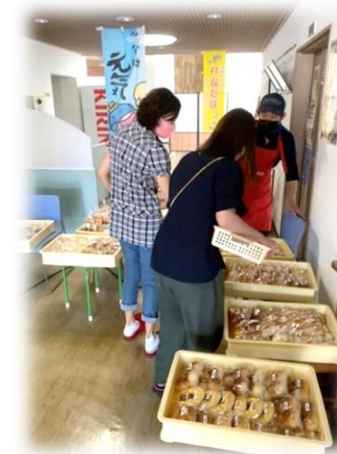
多賀町 シルバー人材センター様