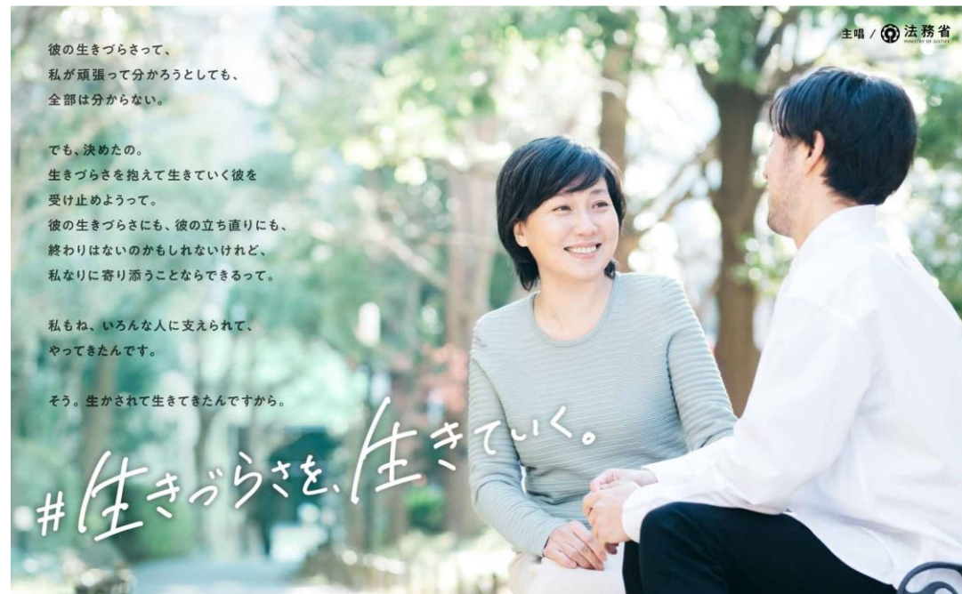
犯罪や非行を防止し、立ち直りを支える地域のチカラ 第71回 社会を明るくする運動