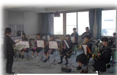
甲良中吹奏楽部の演奏