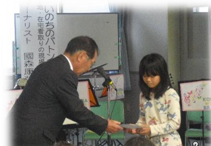
福祉の絵画・川柳 表彰式