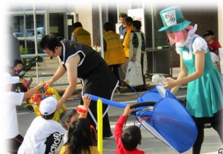
ジャグリング・バルーンアート体験