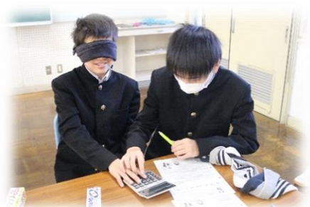
目隠し体験の様子

今後も社会福祉協議会では、小中学校の福祉体験学習を通じて「みんなのしあわせ」を共に考え、実現に向けて考えるきっかけになるよう学習の支援をしていきたいと思ひます。