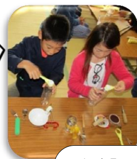
自助具・アイマスク体験