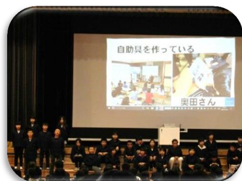
講師のみなさんから、大切な事は「最初からできないと思わないでチャレンジすること」 「関わっていくこと、話をする事」「人をまなえていくこと」だと教えていただきました。