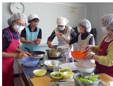
給食サービスボランティア調理研修