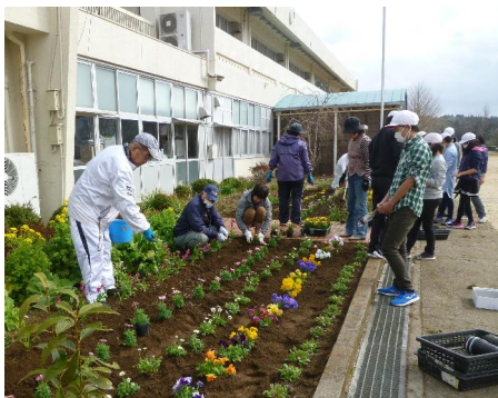
「日吉小花植え」日吉・水上地区社協、 生涯大学長柄同窓会