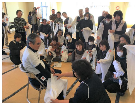
「防災講習会・救急法」ボラ連