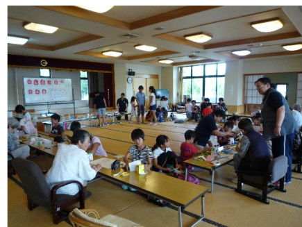
ミニデイサービスの高齢者と学童の交流