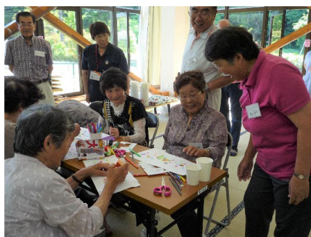
サロン「いってんべ」日吉・水上地区社協