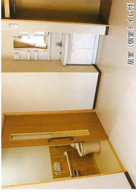
居室（個室トイレ付）

“朝陽”と“夕陽”の2棟からなり各9つの居室（トイレ付き各2室）があります。クリーニングされた清潔な寝具が備え付けてあります。