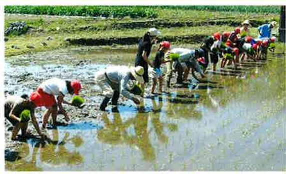
地域の方に教えていただきながら田植え体験を行いました。