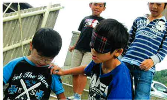
目が不自由な方大変さを理解するためにアイマスク体験を行いました。