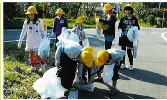
にしきつクリーンアップウォークラリーでは、全校で地域のゴミを拾いました。