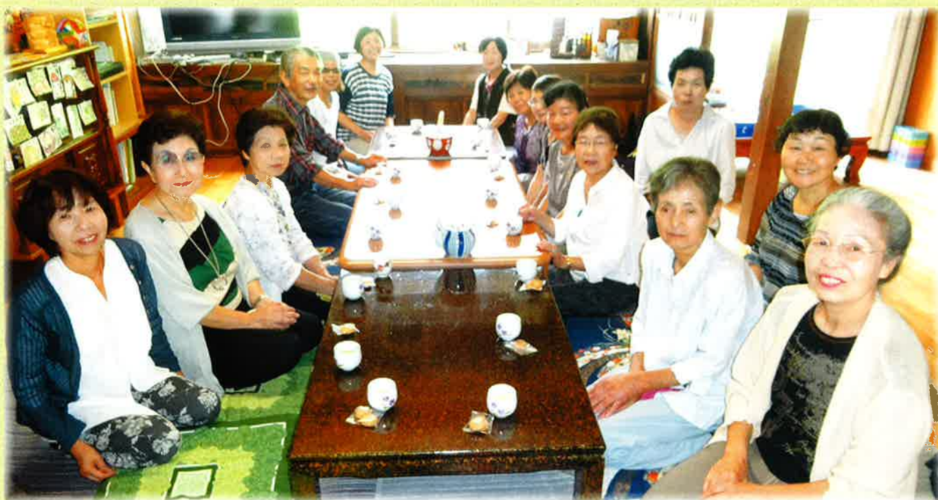
福地お元気サロン（ふくちゃん）