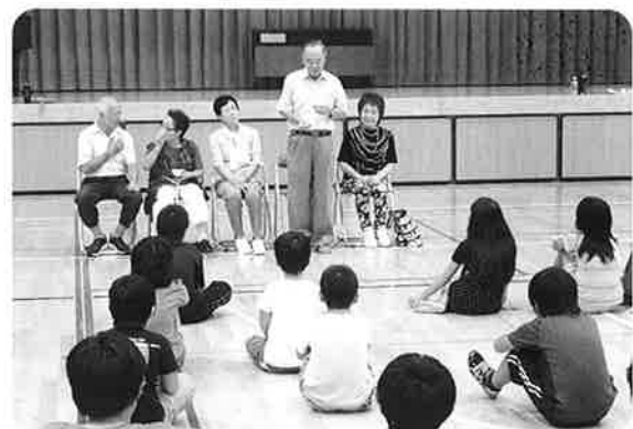
障がい者の方とのふれあい