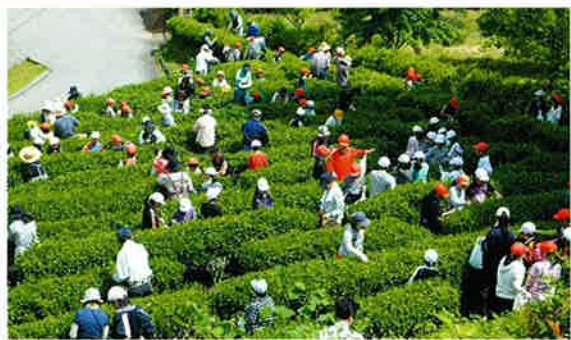
地域の皆さんと一緒に学校茶園のお茶摘み、手もみ作業を行いました。

本会では、町内の全小・中・高等学校を福祉協力校に指定し、児童・生徒が奉仕・ボランティア活動を通じて福祉の心を育む活動を各学校で行っていただいております。今回は錦津小学校の取り組みについて紹介します。