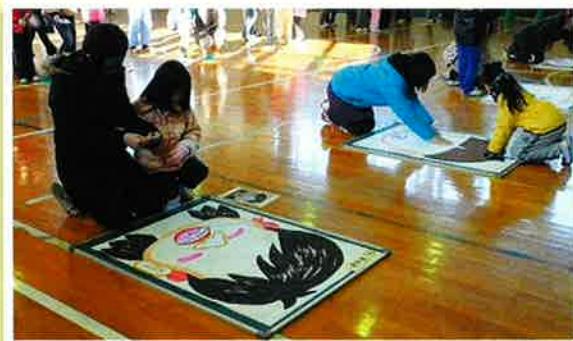
家族と一緒に「昔の遊び」を楽しむ会を行いました。