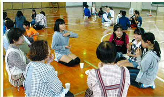
お世話になった方々とお茶を飲みながら交流会を開きました。