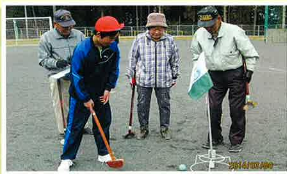
高齢者の方とグラウンドゴルフによる交流会を開催しました。