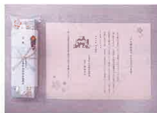
鉛筆のセットを 贈呈しました