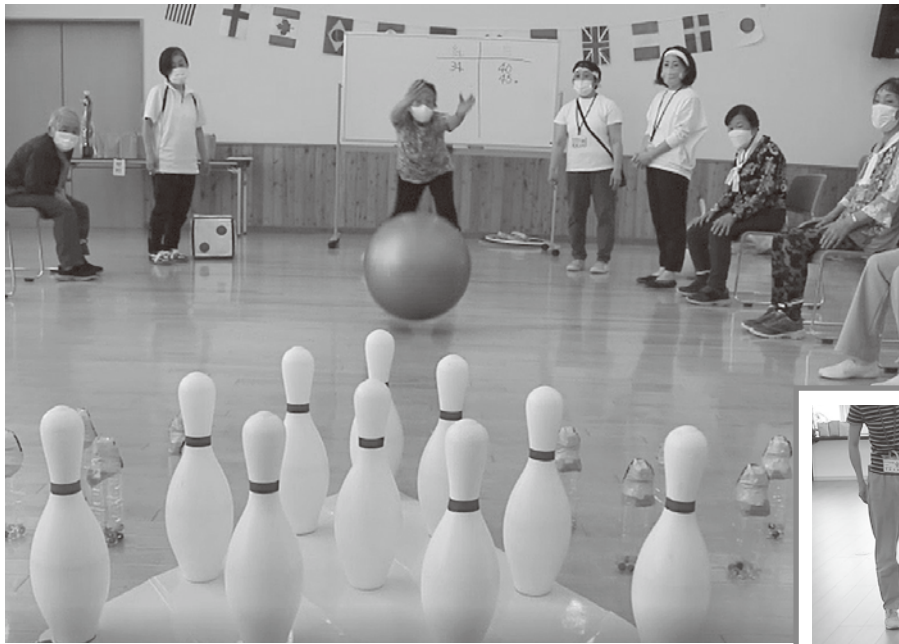
みんな大好きボウリング♪