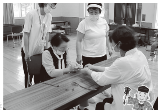
こよりを作っての紙相撲☆