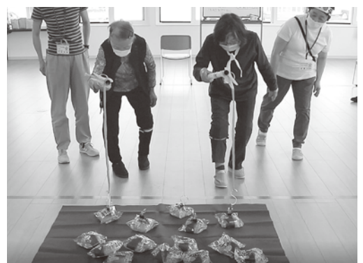
パン喰いならぬパン釣り競争😊

一日通して競技を行ない、 大きな盛り上がりを見せ ました。皆さんものすごい パワーがあり、終始元気 ハツラツでした!!