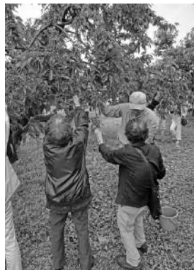
1人暮らしの集い (サクランボ狩り)