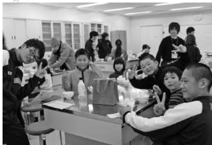
ボランティア講座 (アイスクリーム作り)