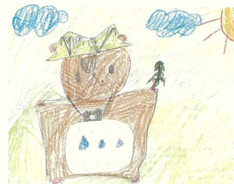
東川在学中の学生さんの作品

ひがしかわにちなんでいるから。モモン ガで帽子は山の形でもようがいなほです。 手に持っているのもいなほです。首にかけ ているのがカメラでおなかの模様は水のし ずくもようにしました。