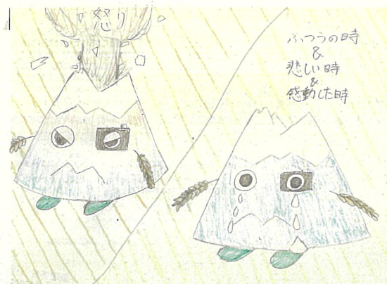
東川町在学中の方の作品

大雪山のめぐみを受ける東川町をイメージしてかわいいキャラクターにしました。大切にしてほしいという願いも込められています。泣くと出てくるなみだは旭岳湧水、片目はカメラできれいな景色や人々の様子を撮ります。手は稲、身体は大雪山をイメージしました。