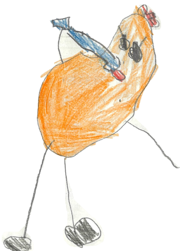
東川在住の小学生の作品

東川のお水がおいしいから、みずのみさんという名前にしました。みずのみさんは水をのまないとかげでない