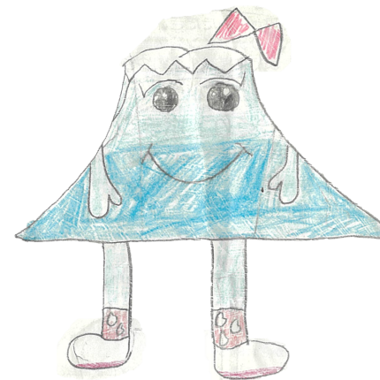
東川在住の小学生の作品

大雪山の「せつ」とこの子は子どもなので「こ」をつけてせつこちゃんという名前にしました。この子は5歳、お水が大好き。性格はてんねん。