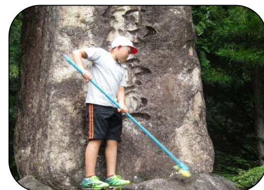
大又の慰霊碑を清掃