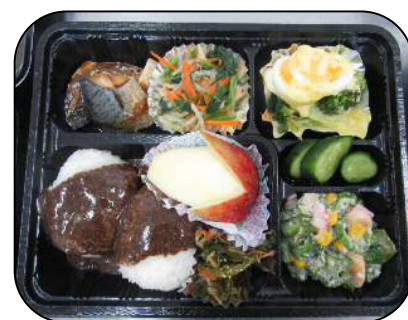
9/22のお楽しみ弁当 えごまの五平もちがおいしそう！