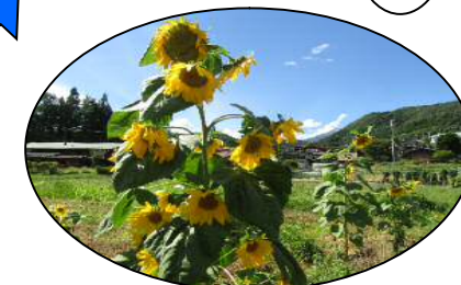
花畑のひまわりもきれいに咲きました。