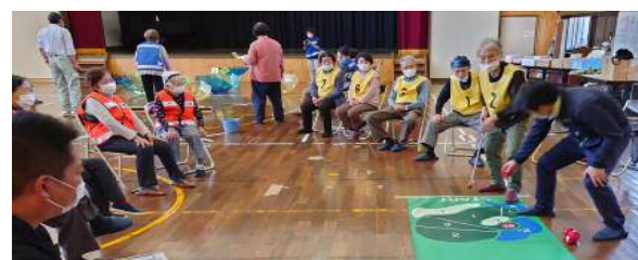
「ご長寿カップ」競技大会