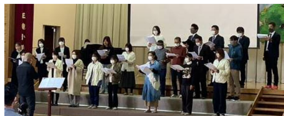
昨年の小学校芸術祭のようす