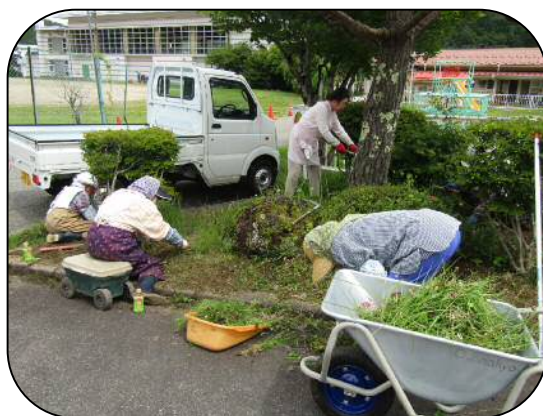
6/23 センターの花壇の草取り

村の施設の花植えや草取りなどを、「ぼちぼち」と都合のいい時に行っています。6月には、5名の方が、保健福祉センターの草取りを行ってくださいました。花が草の中で窮屈そうに咲いていましたが、とてもすっきりきれいになりました。みなさん、いつも助かっています。