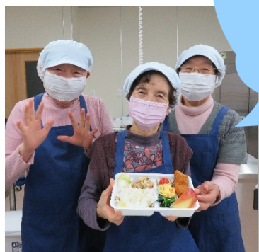
調理ボランティアの皆さん

みんなで活動できるのが安心で、楽しい！ お話をしたり、自分の家とは違う料理を教わったり。 自分の予定に合わせて当番を決めてくれるので、 とても参加しやすいです。もっといろいろな人に、 気軽に参加してほしいです！