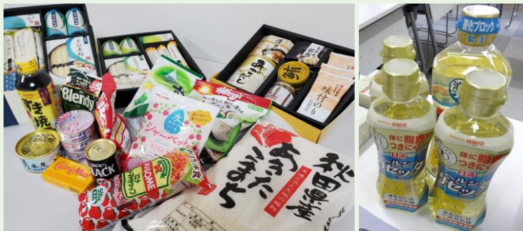
※写真は、今回のキャンペーンで集まった食品の一部です。

長野県内「年末一斉フードドライブキャンペーン」を実施したところ、多くの皆様から食品をご提供いただきました。いただいた食品は、木祖村の必要な方にお届けさせていただきます。