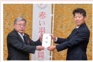
▲刈羽ライオンズクラブ様