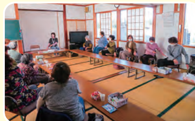
〈赤田北方集落サロン〉