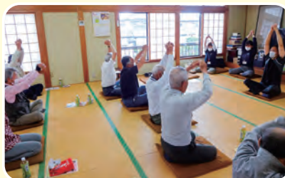
〈割町新田集落サロン〉