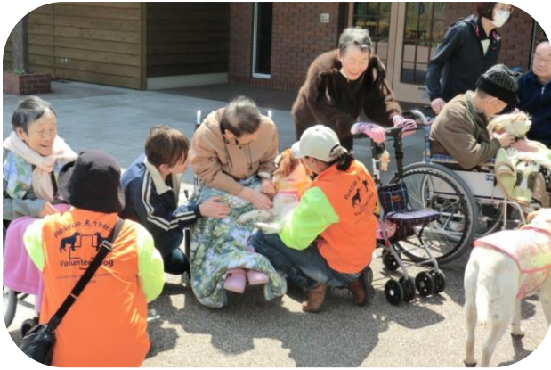
▲ゆにガーデンでセラピー犬とのふれあい（ほほえみの家）