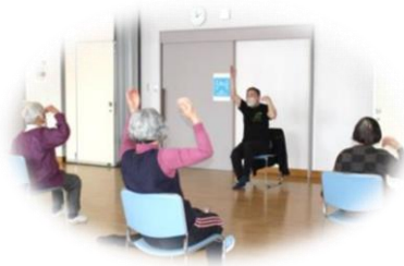
▲前回のイベントのようす