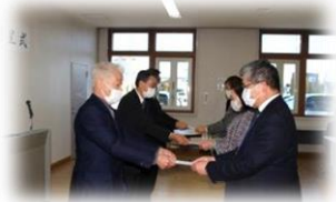
▲歳末たすけあい贈呈式