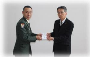
▲第72戦車連隊陸曹団から松岡共募会長へ