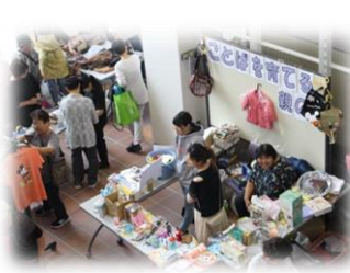
▲チャリティーバザーは大賑わい！