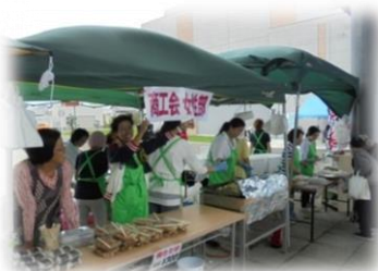
▲今年、初参加の由仁町商工会女性部による焼鳥コーナー

ふれあい広場はJAそらちみなみちゃんを迎えてのオープニングセレモニー、チャリティーバザーや焼鳥などの即売店のほか、救急救命コーナーなどを開催しました。また、毎年大好評のお楽しみ抽選会も大盛り上がりで参加者は楽しい一日を過ごしました。