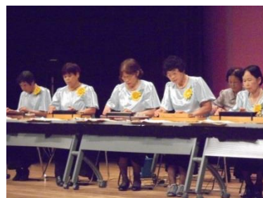
福祉のつどい 演芸発表