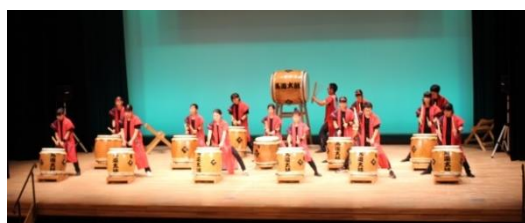
由仁馬追子供太鼓