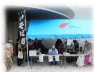
▲毎年恒例、手打ちそばコーナー