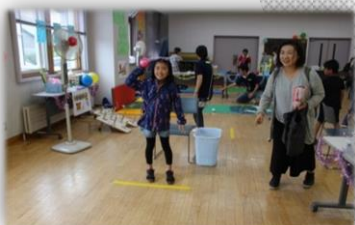
▲ゲームコーナーのナンバーストライクで大当たり！