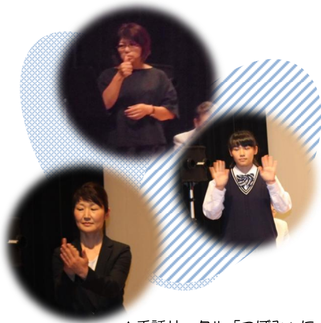
▲手話サークル「つぼみ」による手話通訳