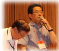
▲お楽しみ抽選会 はダブルチャンス で大盛況！！