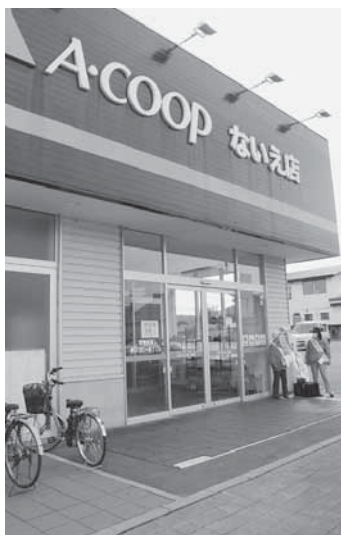
(エーコープないえ店前)