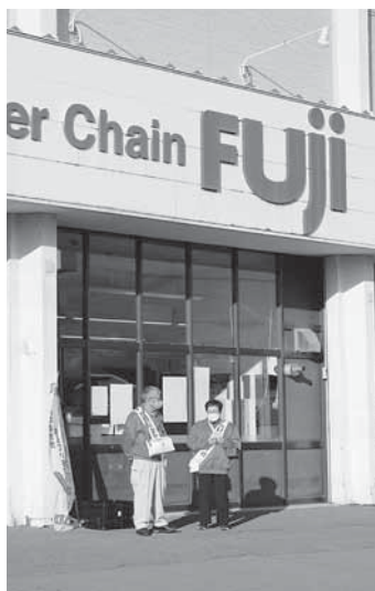
(ふじアシルマート奈井江店前)