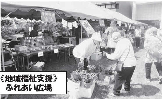
《地域福祉支援》 ふれあい広場