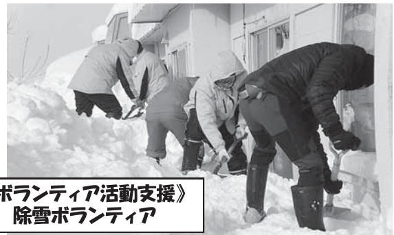
《ボランティア活動支援》 除雪ボランティア