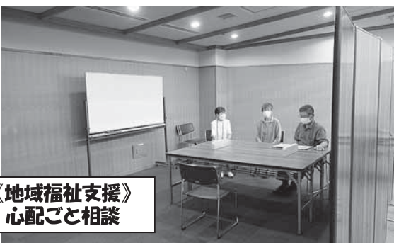
《地域福祉支援》 心配ごと相談