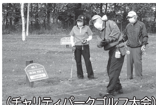
(チャリティパークゴルフ大会)

10月1日から12月31日までの3カ月間、「赤い羽根共同募金運動」が実施されます。