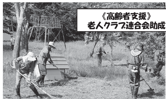
《高齢者支援》 老人クラブ連合会助成