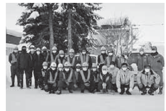
（ボランティア除雪）

会員数の強化、家事援助サービスや草刈除草、除排雪業務等の作業を実施（受注件数 565 件 / 8,170 時間）