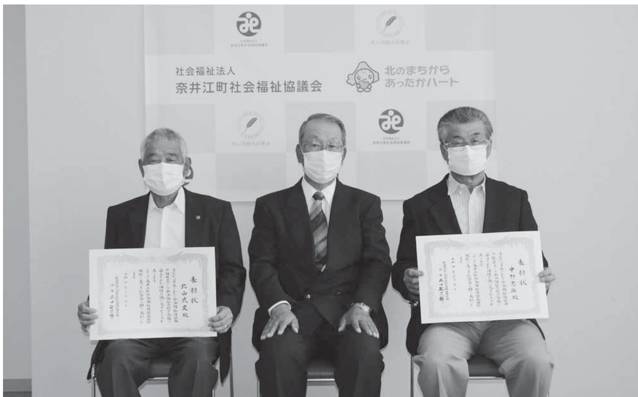
(奈井江町社会福祉協議会表彰状贈呈式)

(発行所) 奈井江町社会福祉協議会 (電話65-6066 FAX65-6067)