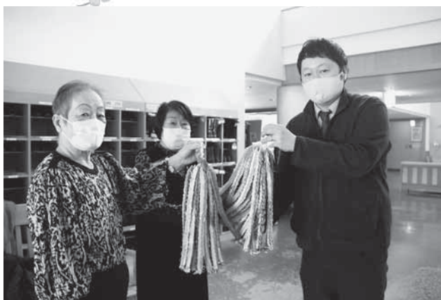
《健寿苑・やすらぎの家》