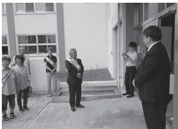
【町内パレード（奈井江中学校訪問）】