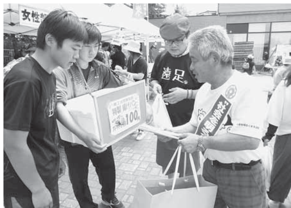
【「ふれあいまつり」街頭啓発】