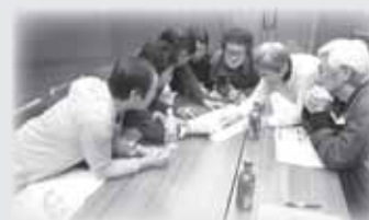
(レクリエーション)