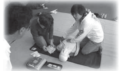
実 技②:AEDを用いた心肺蘇生