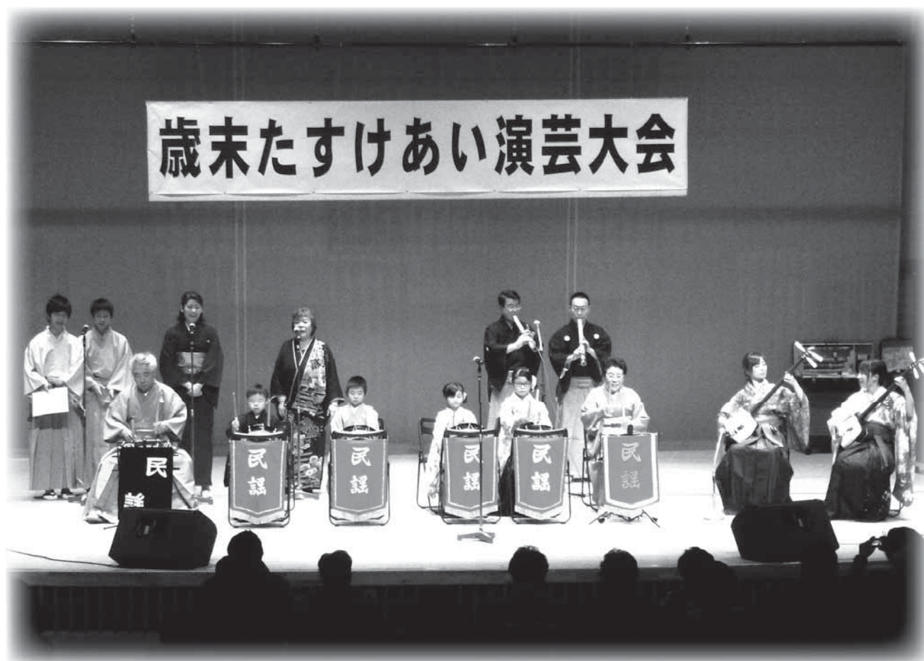
(写真: 歳末たすけあい演芸大会より)

(発行所) 奈井江町社会福祉協議会 (電話 6 5 - 6 0 6 6 F A X 6 5 - 6 0 6 7)