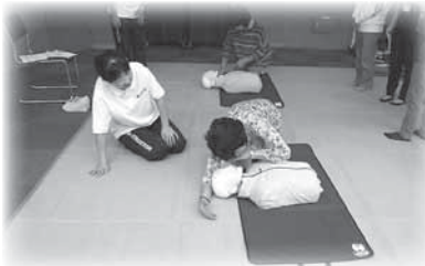
実 技①:呼吸を見る→胸椎圧迫