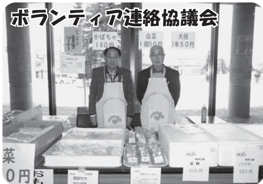
ボランティア連絡協議会