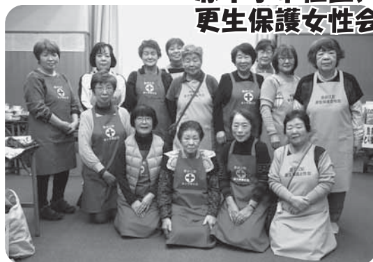
赤十字奉仕団、 更生保護女性会