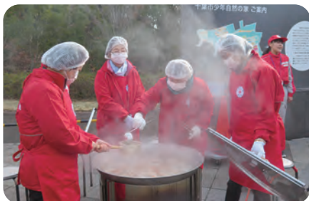
スタディセンターでの炊き出し