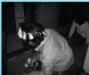
ひとり暮らし高齢者住宅補修