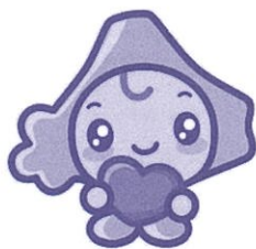
社協イメージキャラクター 「ほっとちゃん」