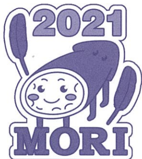
イメージキャラクター 「イカもりくん」