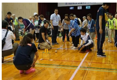
(同日開催されているスポーツ大会の様子)