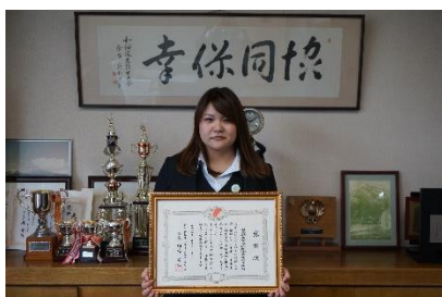
新函館農業協同組合 森基幹支店 様

近年顕著な共同募金運動をされている団体に、北海道共同募金会より感謝状が授与されました。