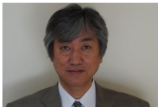
(新しく就任した、住吉事務局長)