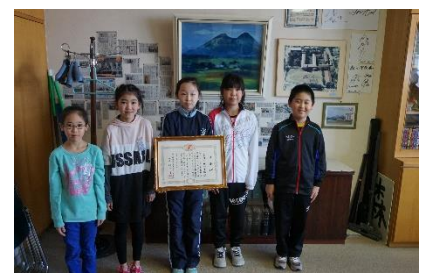
森町立森中学校 様