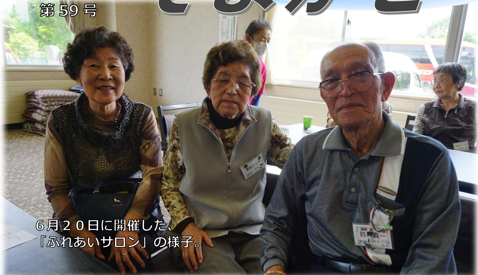
6月20日に開催した、「ふれあいサロン」の様子。