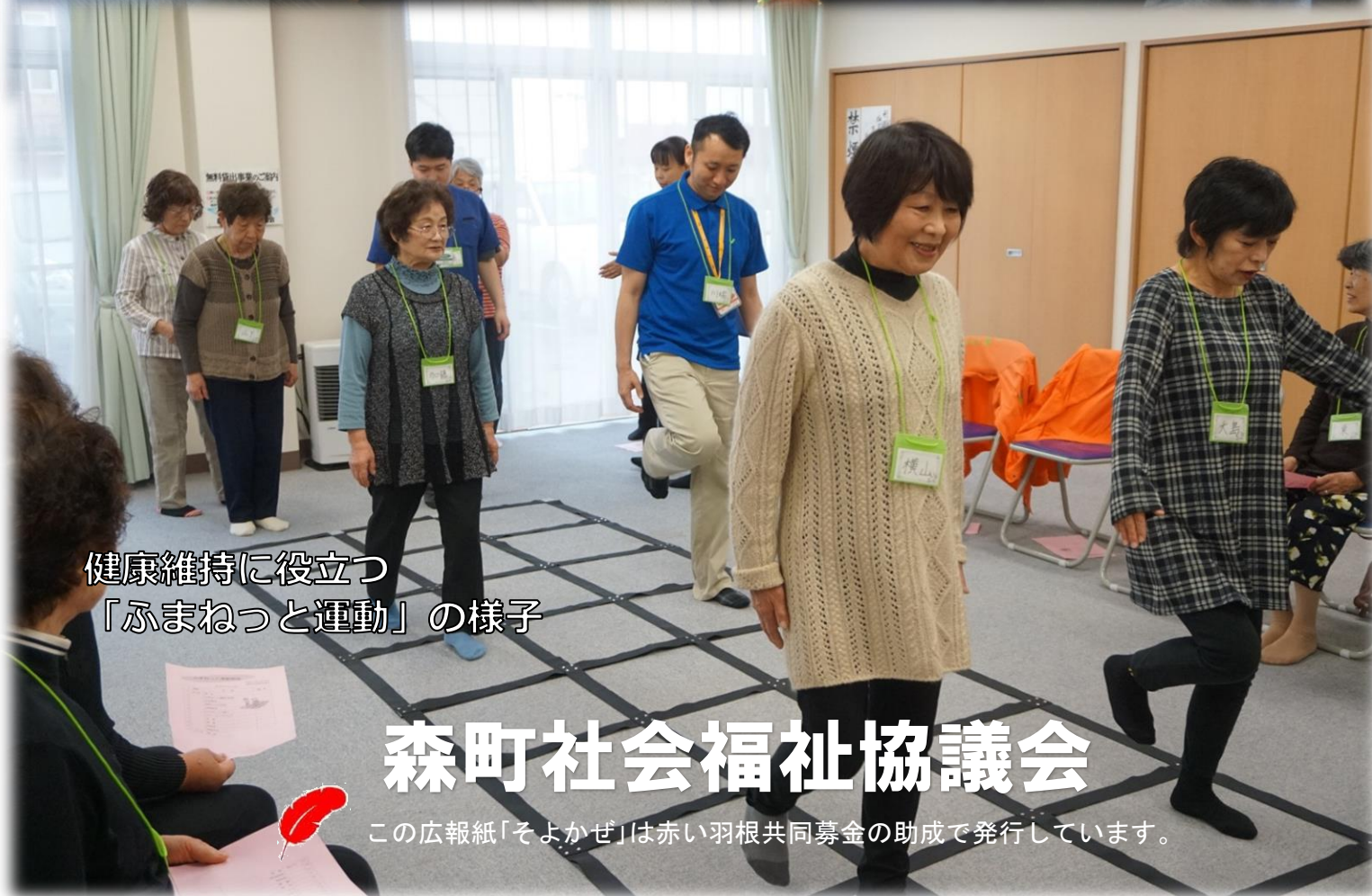
健康維持に役立つ 「ふまねつと運動」の様子