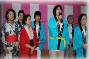
森町ボランティアの会さん