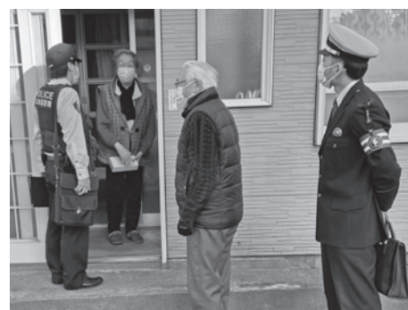
高齢者ひとり暮らし見守り隊 (唐津町内会) ※松前警察署と合同訪問の様子

★★共同募金インターネット情報サイト★★ 共同募金のことならインターネットにて情報がわかります。