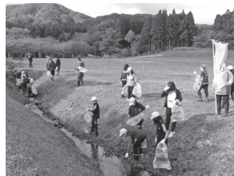
ホタル生息河川清掃(松城小学校)