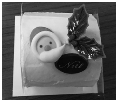
慰問品のクリスマスロールケーキ（上段）と 小学生が作成したメッセージカード（下段）

令和3年12月5日（日）町内在住の70歳以上の一人暮らしの方592名を対象に大島・小島・松城小児童が作成したメッセージカードとクリスマスロールケーキを慰問品とし、松前高校生ボランティア7名・地区民生委員・町内会・婦人会（部）・松前ライオンズクラブ会員等のご協力のもと、世代間交流を図りながら安否確認を踏まえた見守り活動の慰問を無事に行うことができました。