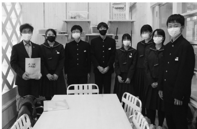
学校募金（児童会・生徒会）での活動の様子