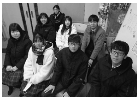
松前高校 ボランティア