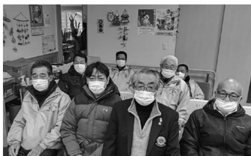
松前ライオンズクラブ ボランティア