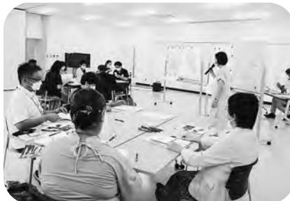
▲生活支援体制整備事業協議体