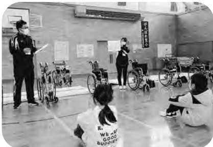
▲福祉教育（福祉体験学習）