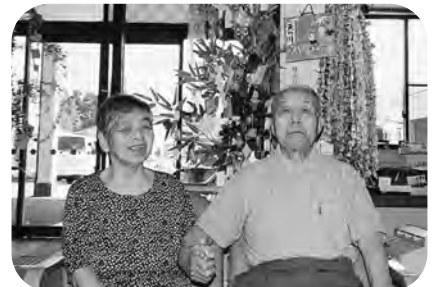
▲小野田西部デイサービスセンター